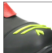
HAIX® High Durability Cap System