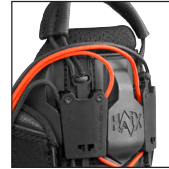
HAIX® RAPIDFIT System