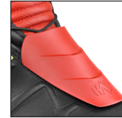
HAIX® 3Z Protector System