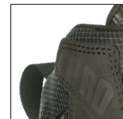
HAIX® Climate System