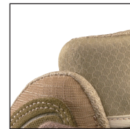
HAIX® Climate System