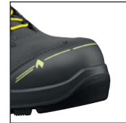
HAIX® Nano-Carbon Schutzkappe