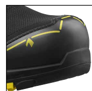
HAIX® Composite Schutzkappe