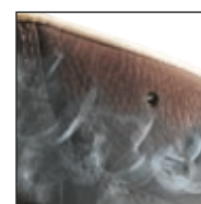
HAIX® Climate System