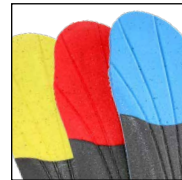
HAIX® Vario Wide Fit System