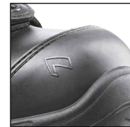
HAIX® Composite toe cap