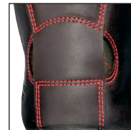
HAIX® FP System