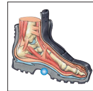
HAIX® AS System