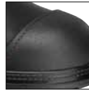
GÜK mit versenkten Nähten