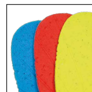
HAIX® Vario Wide Fit System