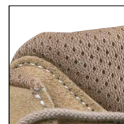
HAIX® Climate System