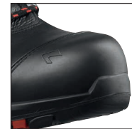
HAIX® Composite Schutzkappe