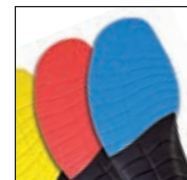
Vario Wide Fit System