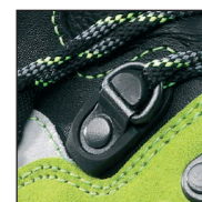
HAIX® 2-Zone Lacing