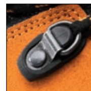
HAIX® 2-Zone Lacing