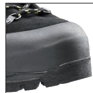
Spitzen- und Fersen- schutz aus Gummi