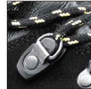
HAIX® 2-Zone Lacing