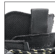
Doppelte Zunge für beste Druckverteilung und Anpassung