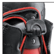
HAIX® FL Fit System