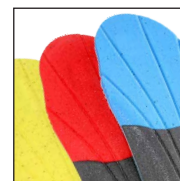
HAIX® Vario Wide Fit System