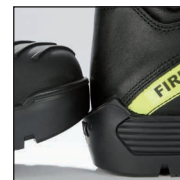
HAIX® ES Out System