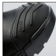
HAIX® HD Cap System