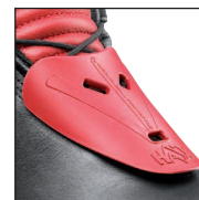
HAIX® 3Z Protector System