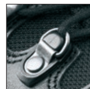
HAIX® 2-Zone Lacing